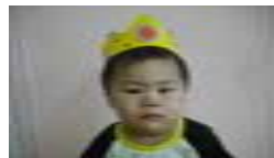
こだま いびきくん(3歳)